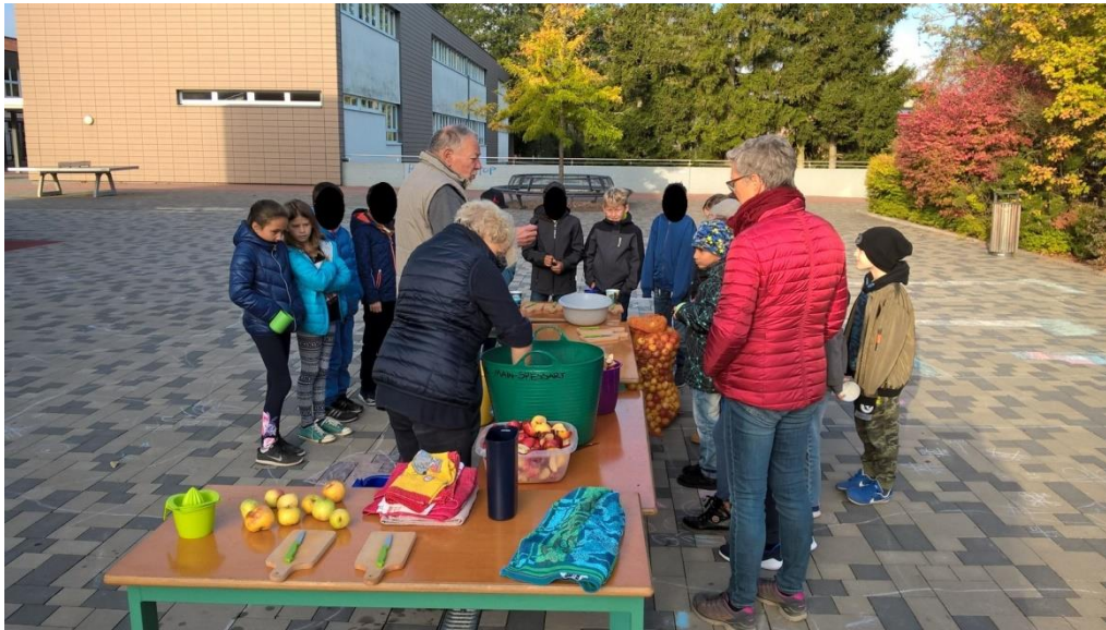
Oben: Die Äpfel werden vorbereitet

Seit einigen Jahren betreut der BUND Naturschutz (BN) die städtische Streuobstwiese am Rebschnittgarten in Marktheidenfeld. Ziel ist dabei nicht nur durch Pflegemaßnahmen einen einzigartigen Lebensraum zu erhalten, sondern vor allem auch Kindern Bedeutung und Nutzen der heimischen Streuobstwiesen näher zu bringen. Im Rahmen des Umweltbildungsprojektes bieten die Aktiven deshalb jedes Jahr Aktionen rund um Streuobstwiesen an. Nachdem im vergangenen Jahr die Ernte komplett ausgefallen war, konnten die Aktiven der BN Ortsgruppe Marktheidenfeld heuer wieder säckeweise Äpfel ernten. Einen Teil davon stellten sie der Grundschule zur Verfügung. Dort fand vergangene Woche ein Schaukeltern mit den dritten Klassen statt: vom Äpfel schneiden über das Mahlen mit der Obstmühle bis zum Pressen erlebten sie die einzelnen Arbeitsschritte. Der Höhepunkt war die Verkostung des frischen Saftes und die Kinder stellten erstaunt fest, wie lecker dieser Saft schmeckt.