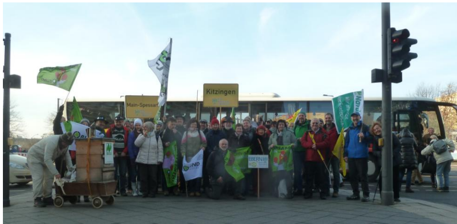
Im Bild (BN): Die Teilnehmer des Kitzinger Busses

Große Demonstration in der Bundeshauptstadt Wir haben es satt!